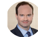
Hans-Wilhelm Dünn Präsident Cyber-Sicherheitsrat Deutschland e.V