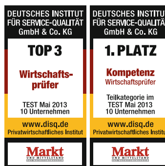
Top-Bewertungen für Warth & Klein Grant Thornton

Wir wurden vom Fachmagazin International Accounting Bulletin zum »Network of the Year 2013« gewählt. 2012 konnte Grant Thornton schneller (10,4 %) als die anderen weltweiten großen Wirtschaftsprüfungsorganisationen wachsen und in kritischen Fragestellungen der Wirtschaftsprüfung wichtige Beiträge leisten, beispielsweise zur Rechnungslegung von Leasing, zur Umsatzrealisierung, zu der EU Grünbuch-Diskussion, zur Corporate Governance oder im Zusammenhang mit der Verbesserung der Berichterstattung zur Abschlussprüfung.